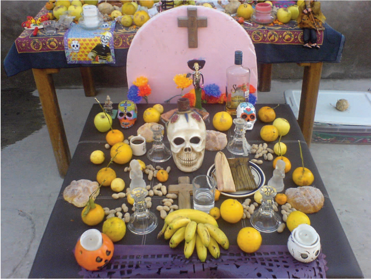
Abbildung 6: Día de los Muertos