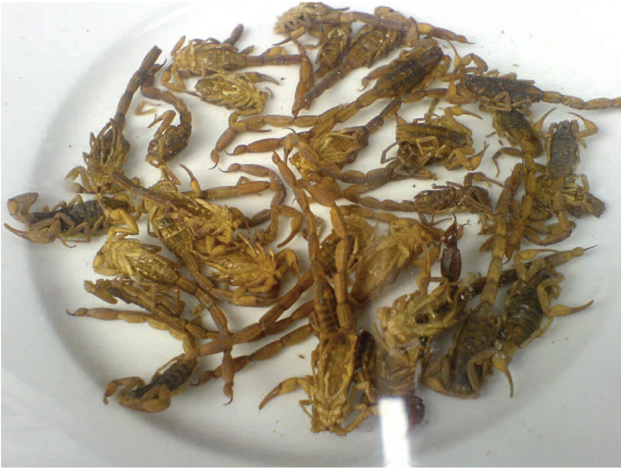
Abbildung 5: Frittierte Vorspeise