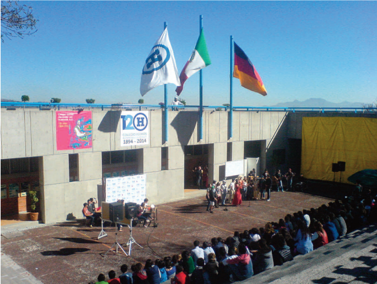
Abbildung 1: 120 Jahr-Feier am Colegio Alemán