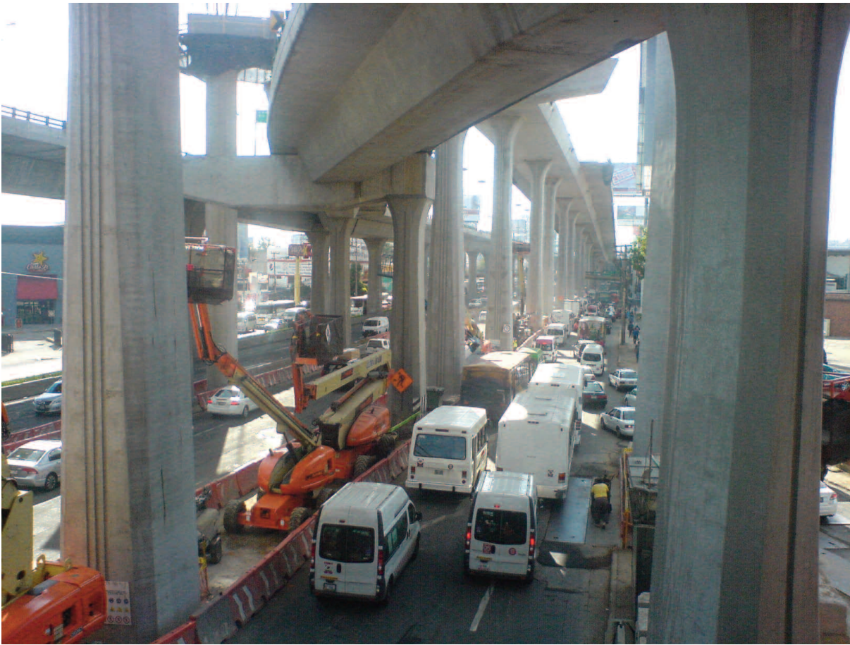
Abbildung 3: Ein normaler Tag auf der Stadtautobahn