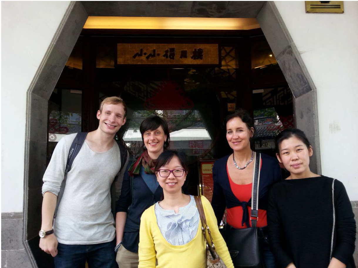
Ausflug in Suzhou