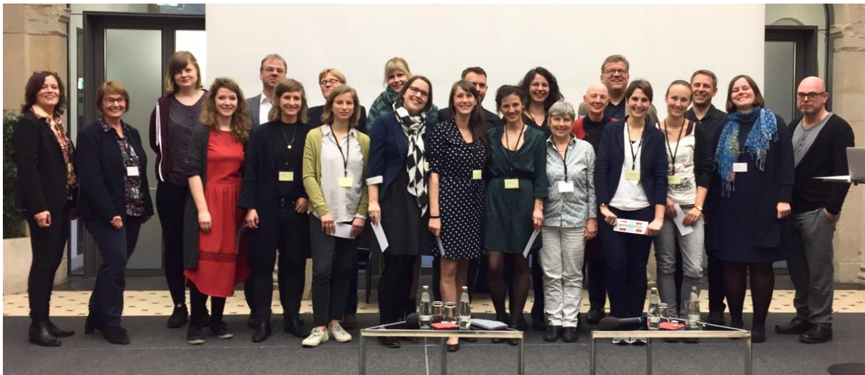
Foto: Mitglieder und Wissenschaftlicher Beirat des Projekts FDQI-HU auf der Abschlusstagung im April 2019

Das Projekt FDQI-HU wird im Rahmen der gemeinsamen „Qualitätsoffensive Lehrerbildung“ von Bund und Ländern aus Mitteln des Bundesministeriums für Bildung und Forschung gefördert.