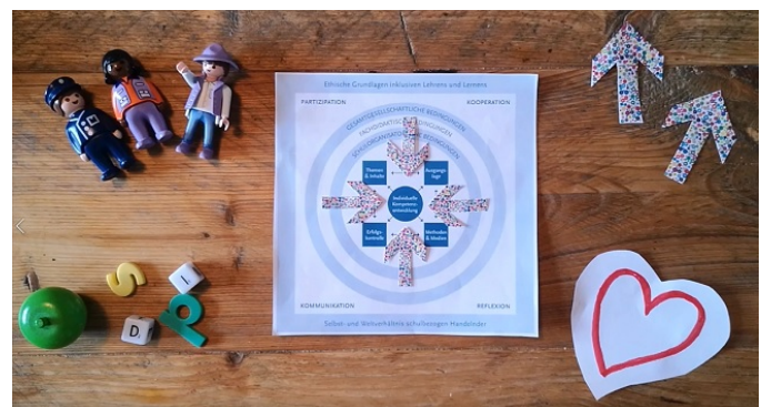
Abbildung 2: Standbilder aus dem Lehrfilm zum DiMiLL