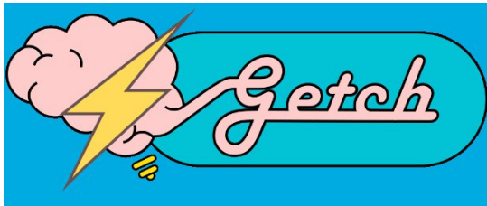
Abbildung 3: Das Logo der App Getch .

Die vor allem für das Dissertationsvorhaben in der Fachdidaktik Mathematik wesentliche App Getch wurde in Kooperation aller Wissenschaftler:innen des interdisziplinären Teams entwickelt und mithilfe externer Programmierexpert:innen umgesetzt. Konzeptioneller Rahmen der App-Entwicklung war der Anspruch, die Bereiche Fach, Inklusion und Digitalisierung als Triade zu