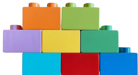
Abbildung 1: Layout und Struktur sind ein wichtiger Faktor für den Erfolg digitaler Lernangebote.

Theoretische Grundlage der Überarbeitung war eine stärkere Ausrichtung am Konstrukt der adaptiven Lehrkompetenz, das als „Scharnier zwischen dem struktur- und dem kompetenztheoretischen Professionalisierungsideal“ betrachtet werden kann (Frohn et al. 2020, S. 35). Diese Interpretation des Konstrukts soll zum einen dazu beitragen, den komplexen, z. T. antinomischen Strukturen und Prozessen alltäglichen Unterrichtshandelns