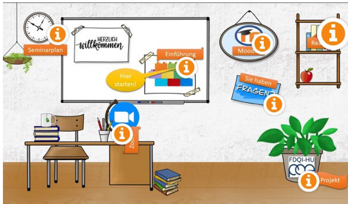
Abbildung 5: H5P bietet auch die für FDQI-Bausteine gute Möglichkeiten die Online-Lehre interaktiv zu gestalten und durch unterschiedliche Zugänge einen wichtigen Schritt hin zu an Inklusion orientierter Lehre zu gehen.

Herbstkonferenz im Oktober 2021) und darüber hinaus (Dritte, z. B. im Netzwerk „Inklusion in der Lehrkräftebildung“ mit sieben QLB-Projekten deutschlandweit) und