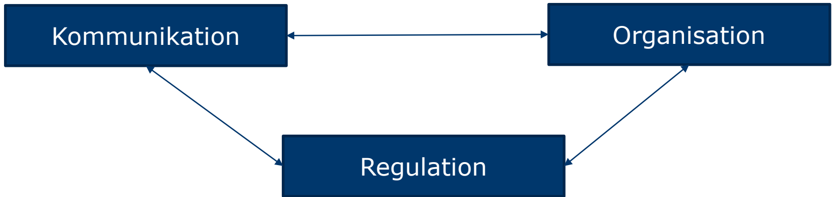
Abb. 1: Modell Klassenführung (nach Haag & Sreber 2012)