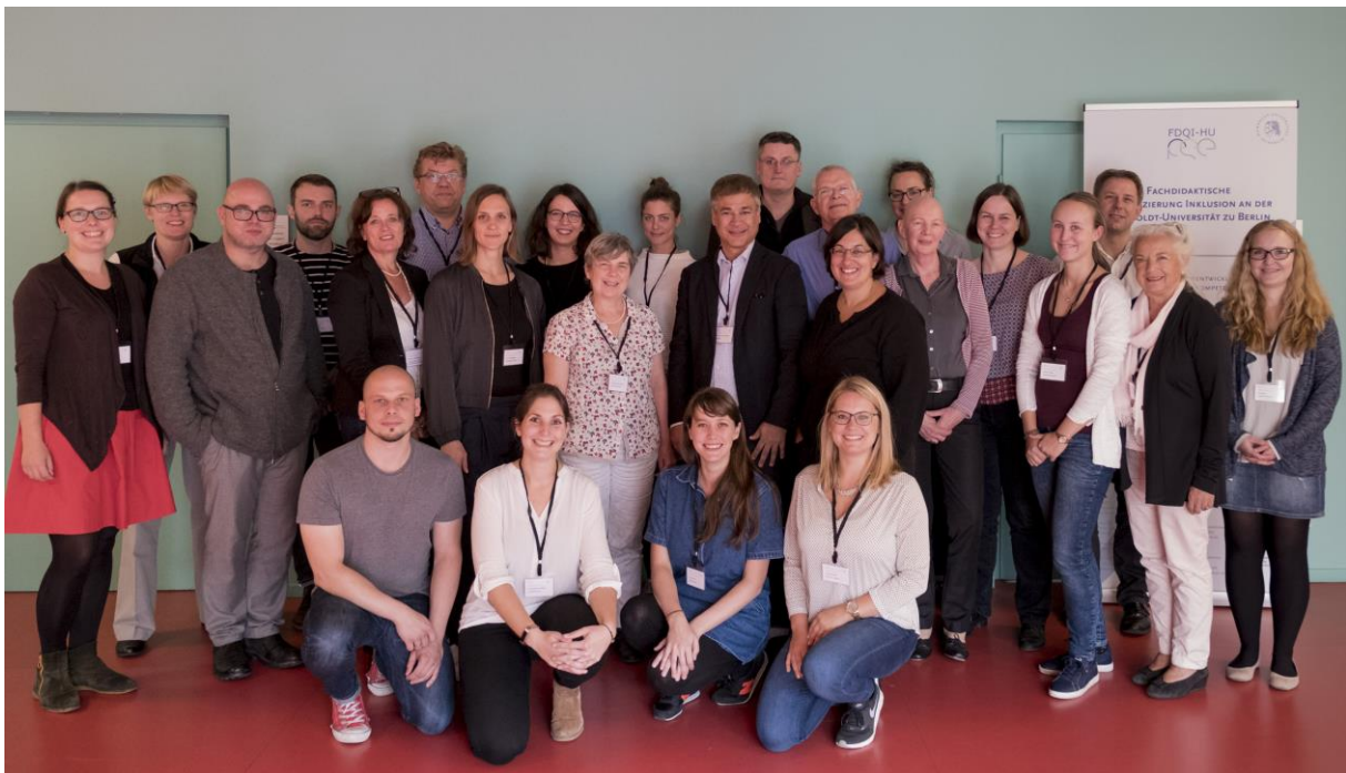
Abbildung: Mitglieder und Wissenschaftlicher Beirat des Projekts FDQI-HU auf dem Gesamtteamtreffen im Oktober 2017

Fachdidaktische Qualifizierung Inklusion angehender Lehrkräfte an der Humboldt-Universität zu Berlin