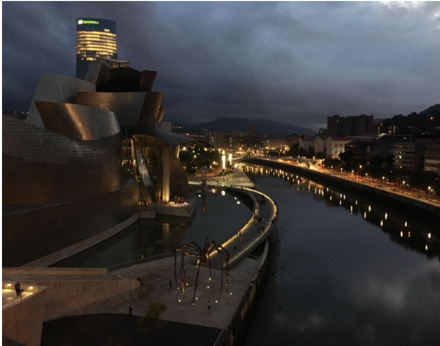
Guggenheim- Museum bei Nacht