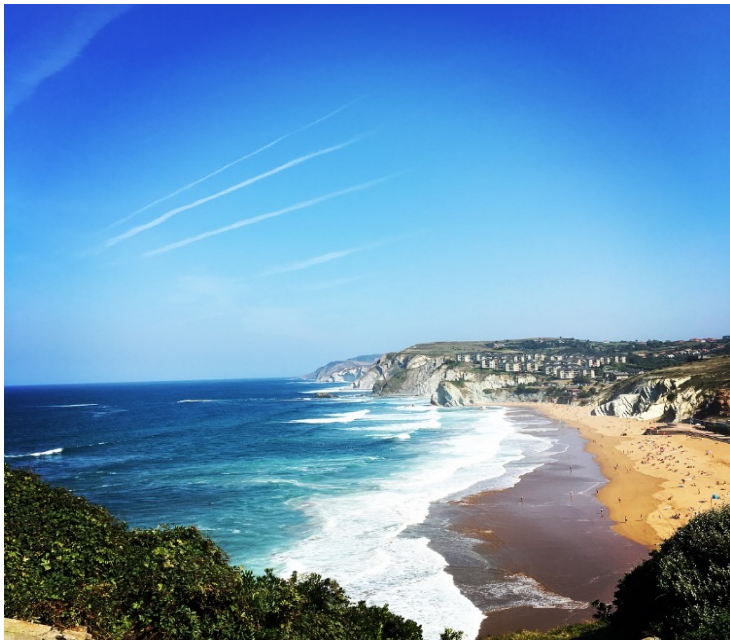
Playa de Arriatera