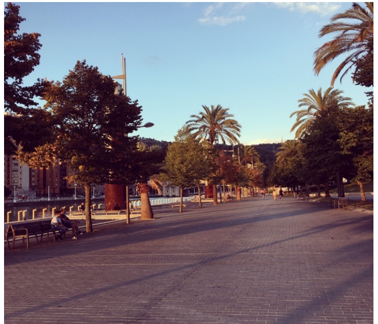
Fußgängerzone entlang der Ría de Bilbao