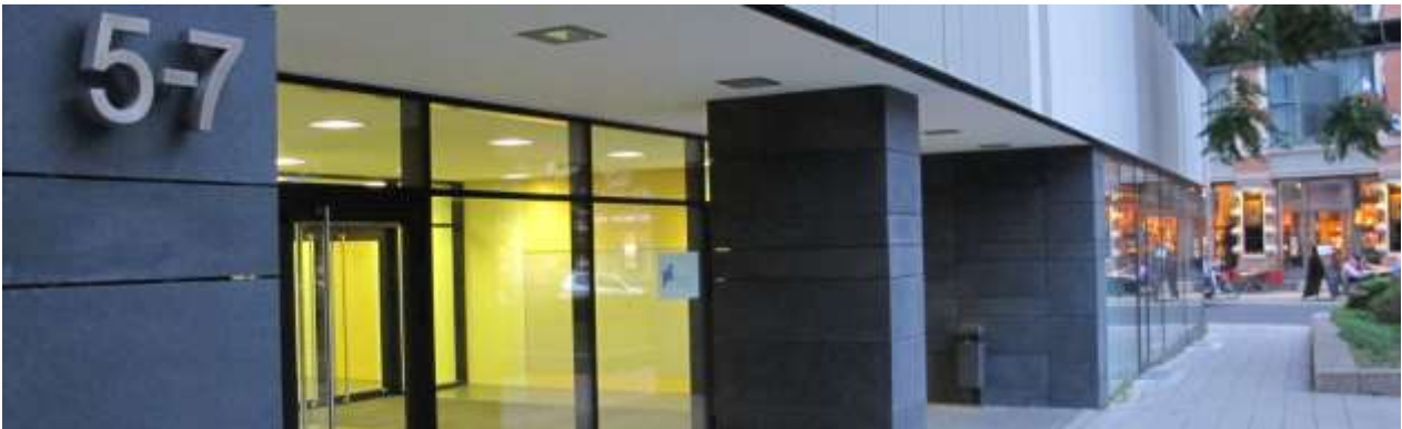
Professional School of Education

Auf den nächsten Seiten finden Sie wichtige Informationen, die Ihnen den Einstieg in den Master of Education erleichtern sollen.