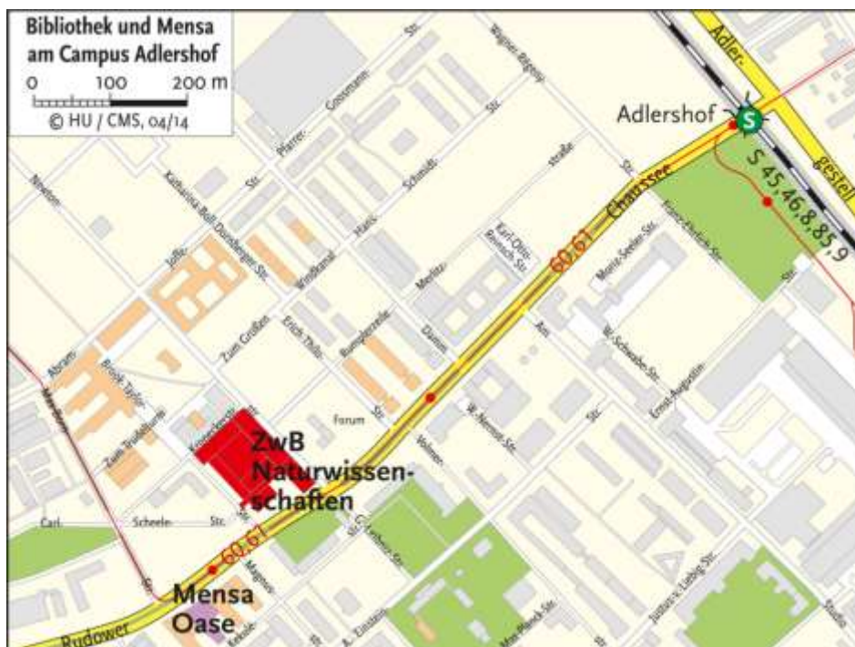
Abbildung 5: Bibliothek und Mensa am Campus Adlershof